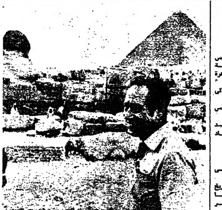
بلونزال في زيارة اعراس الجيزة مصر ( صورة للرايون من اب )

دعا رئيس الدائرة العسكرية في منظمة التحرير الفلسطينية السيد زهير محسن الخديوي بالسياسة الجديدة الى ان يعودوا الى رؤية الامور على حقيقتها وبالقالي الاهتمام بالمشاكل الشعبية . وقد اعان السيد محسن لك رداً على سؤال حول رايه بإمكان اعتماد مؤتمر جيف في ضوء التطورات الجديدة . واستهل السيد محسن تصريحه بقوله : ان تبتت الاحداث والتطورات الواحدة تلو الاخرى سلامة التقديرات التي كنت قد اعطيت حول هذه المسألة - اعتماد جيف - وما نحن الا الى مزيد من الكلام حول عملية الحديث من جيف وغير جيف وكل مساعي التسوية في ظل الظروف الراهنة التي لا يتغير فيها اي شرط من الشروط الموضوعية الضرورية لتحقيق تسوية ما للفرع في المنطقة . ومضى يقول : هل ما زال هناك ضرورة - بعد اعلان ورقة العمل الجديدة الأخيرة المحملة وغير المحملة - الى التأكيد بان العمل معمم على التثبيت بكل ما يمكن من اغصانه حتى الآن من الارض العربية ،